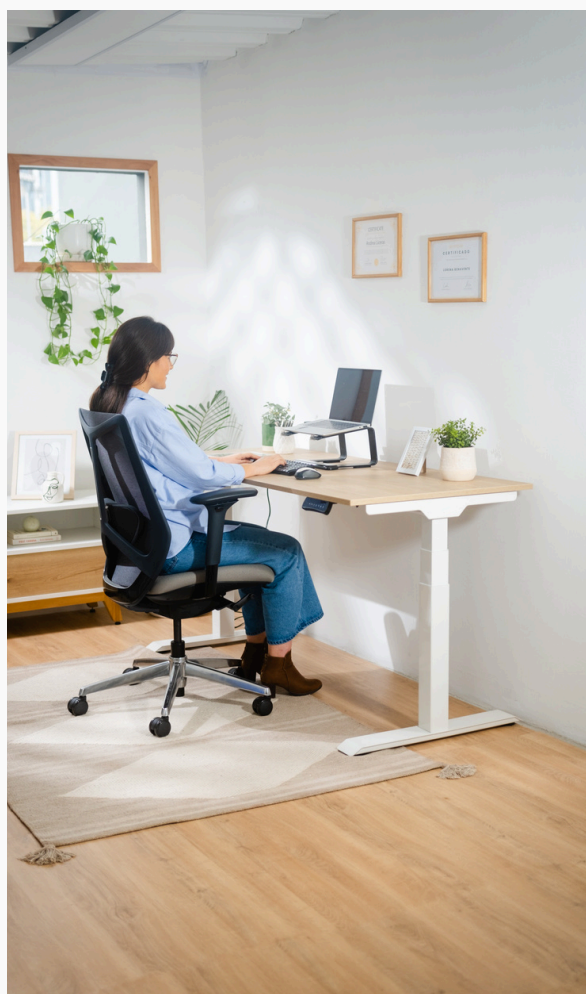
Foto ambientada, productos adicionales y accesorios no incluidos

Incluye vértebra pasacables para una gestión de cableado eficaz